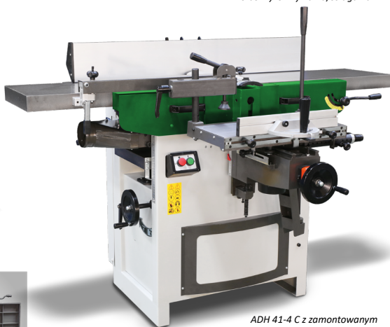
ADH 41-4 C z zamontowanym suportem wiertarskim dostępnym jako opcja