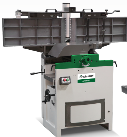
ADH 31-4 C Noże strugarskie na wyposażeniu