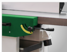
Przestawienie grubości wióra za pomocą dźwigni obsługowej