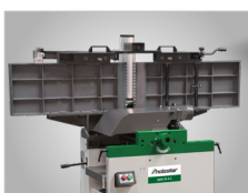
Dużych rozmiarów blaty robocze wykonane z użebrowanego odlewu aluminiowego