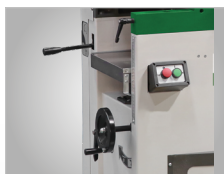
Regulacja stołu grubościówki poprzez pokrętkę ręczną