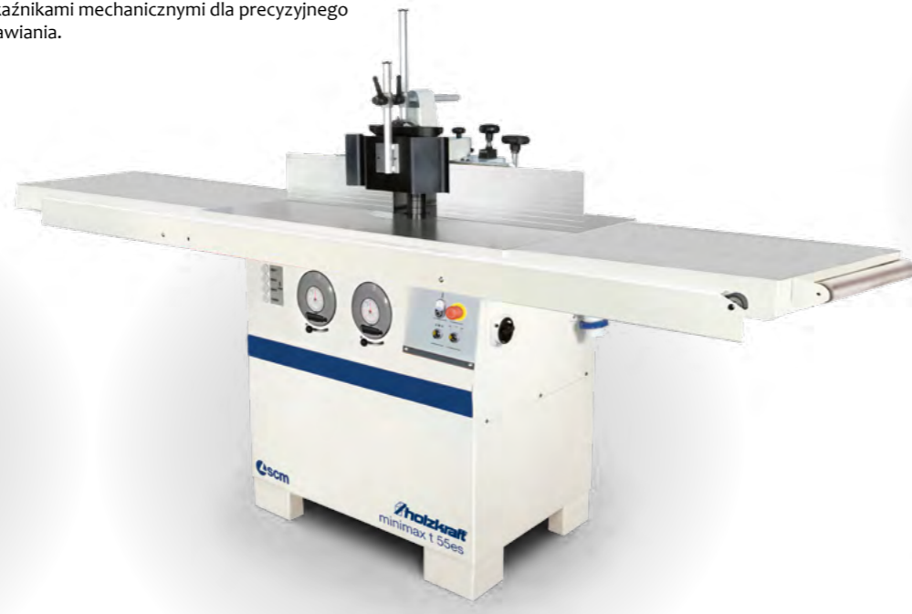
minimax ti 55 es LL