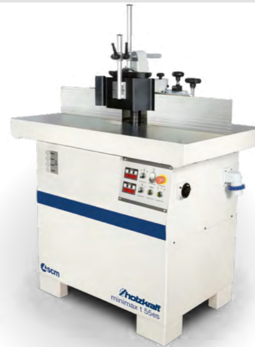
minimax ti 55 es M Digital