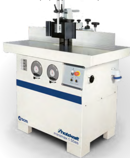
minimax ti 55 es