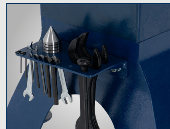
Praktyczny i podręczny organizer na narzędzia