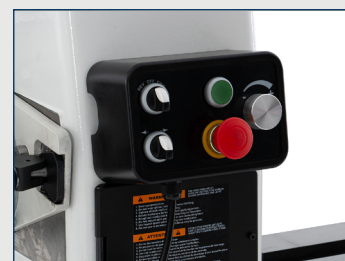
DB 1050 Pro Vario