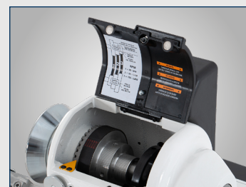
Wrzeciono potrójnie łożyskowane wraz z podziałką oraz solidnym pokrętem