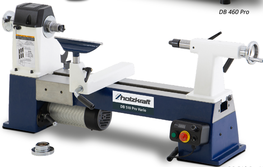
DB 510 Pro Vario