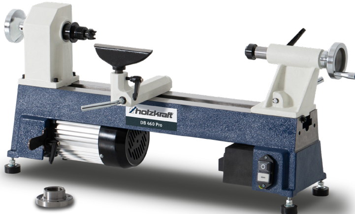
DB 460 Pro