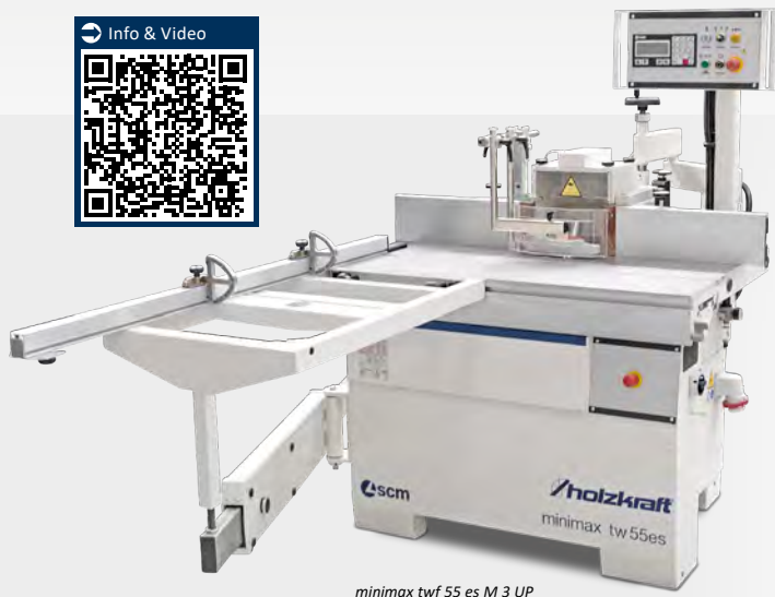
minimax twf 55 es M 3 UP