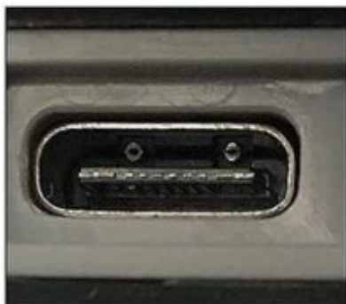
Port ładowania USB-C